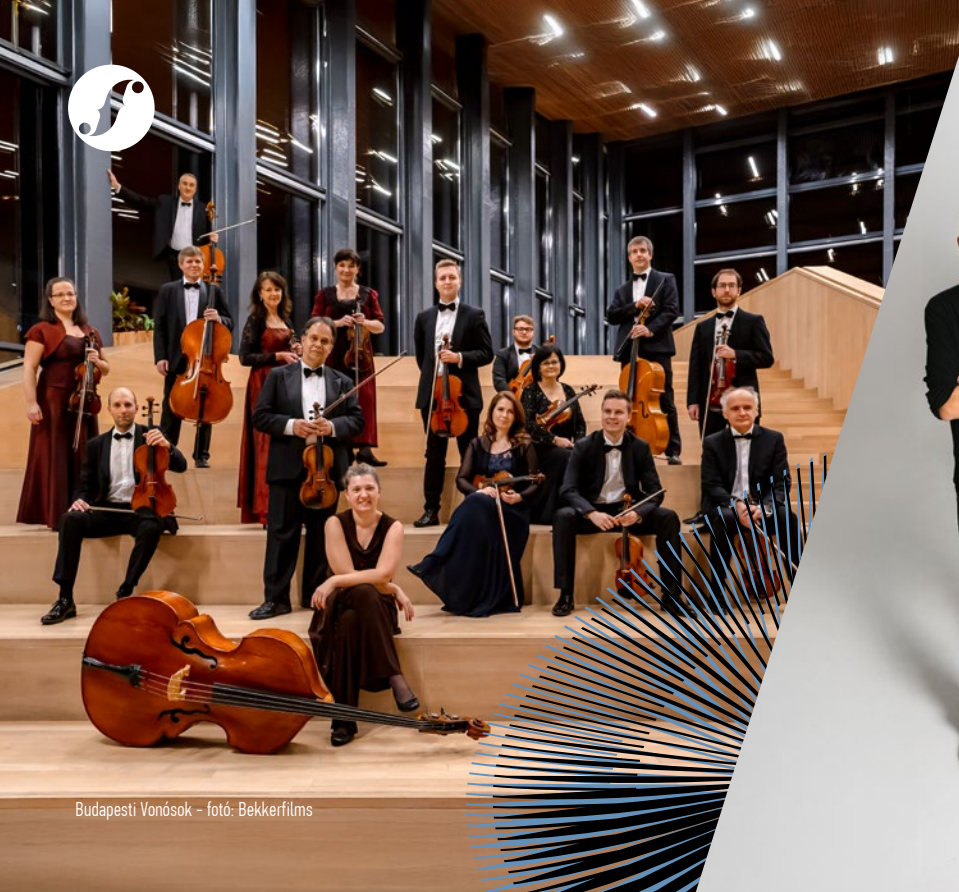
Budapesti Vonósok - fotó: Bekkerfilms