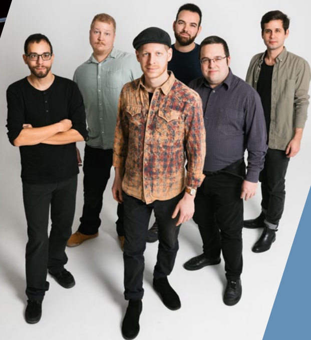
Góbé Folkside